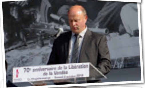
70 ème anniversaire de la Libération de la Vendée 2014 La Chapelle-aux-Lys Samedi 4 octobre 2014