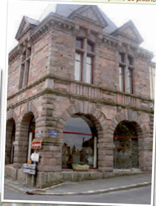
la façade de la salle des halles en pierre de plochères

Découvrez quel lieu se cache derrière cette photo ?