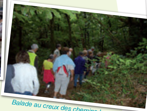
Balade au creux des chemins bocagers