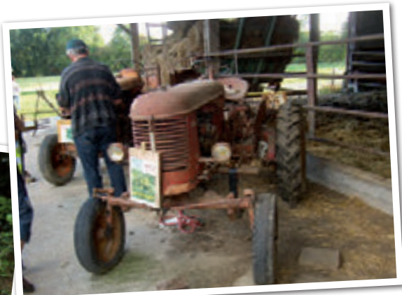
Un passionné de St Maurice le Girard a collecté de nombreux outils agricoles d'antan.