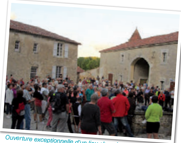
Ouverture exceptionnelle d'un lieu chargé d'histoire le logis de La Cacaudière à Thouarsais-Bouildroux