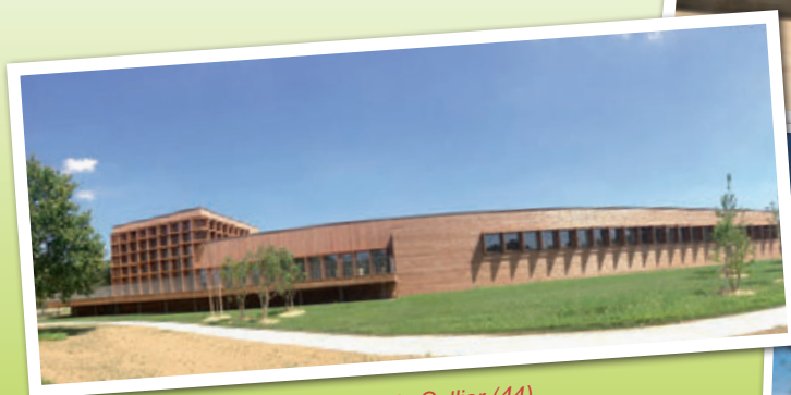
Mairie du Cellier (44)