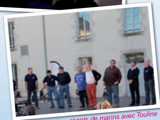
Les chants de marins avec Toulaine et les chanteurs du Ponant