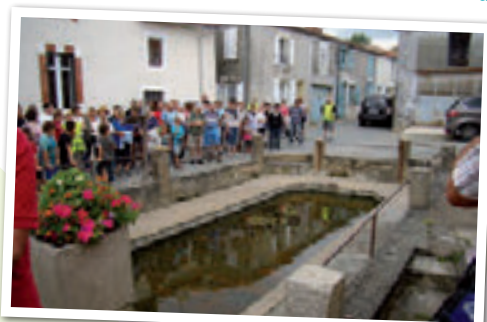
Le lavoir et ses secrets à Moulleron-en-Pareds

L'Office de Tourisme vous donne RDV en 2015 pour un programme qui se voudra « innovant ».