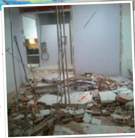
Premiers coups de pelle dans les vestiaires et le hall d'entrée

Le coût des travaux est de 2 200 000€ (frais d'étude, maîtrise d'œuvre et travaux).