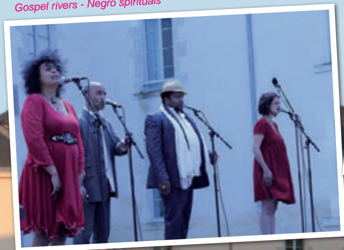
Gospel rivers - Negro spirituals