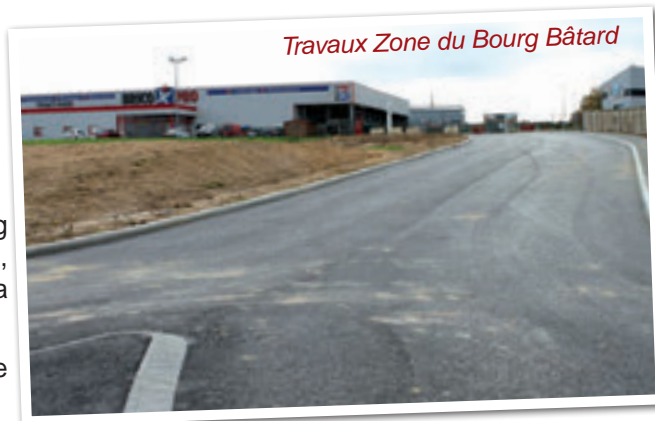
Travaux Zone du Bourg Bâtard