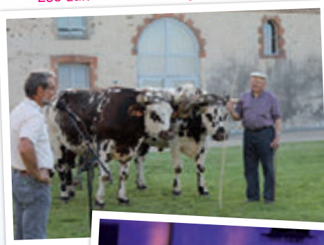
Les darioleurs ont inauguré le festival