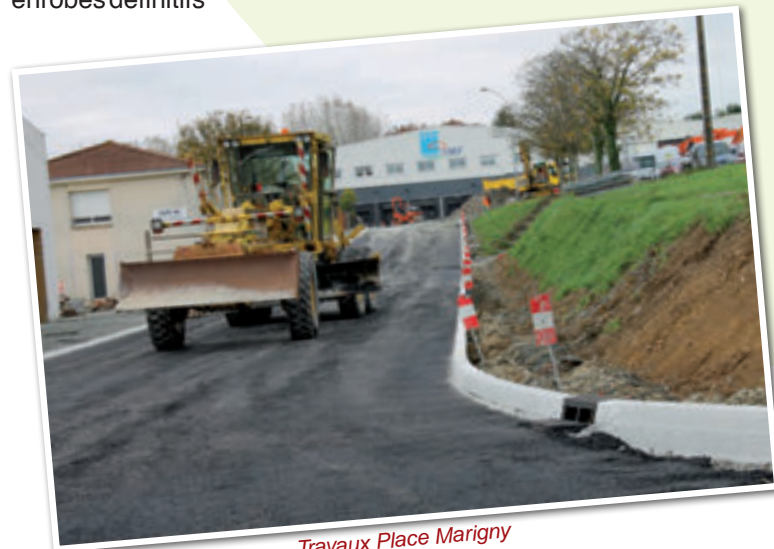
Travaux Place Marigny

Mi-janvier (selon conditions climatiques), pour la réalisation des enrobés définitifs