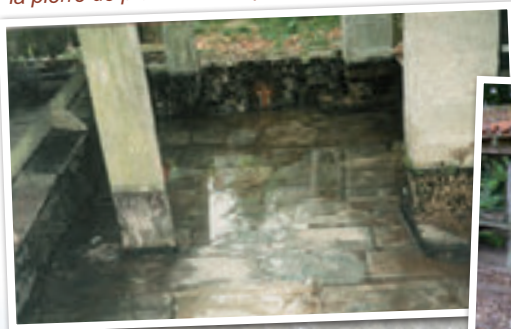
les deux abris encadrent le bassin central

la pierre de plochères est présente jusque sous l'eau