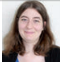
Marine MIMAUULT Secrétariat